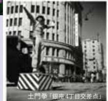
土門拳「銀座4丁目交差点」